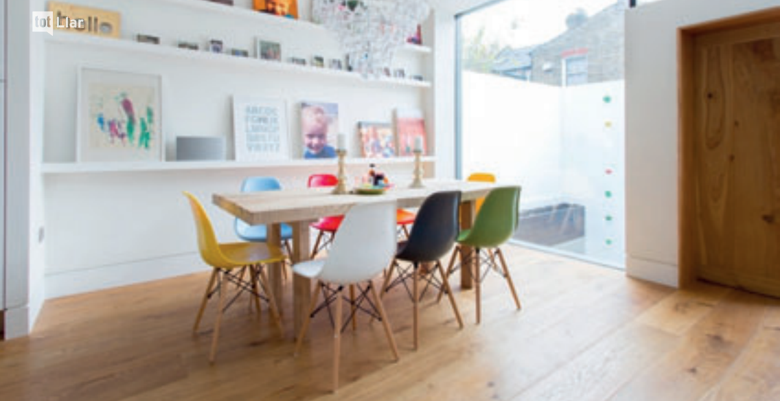
Cadires 'Eames Plastic Chair' de colors.